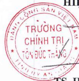
TS. Hồ Ngọc Trường

Lưu ý: học viên nộp 2 quyển và 1 tệp đính kèm (file PDF) cho Phòng Quản lý đào tạo và nghiên cứu khoa học trước ngày 20/4/2022 .