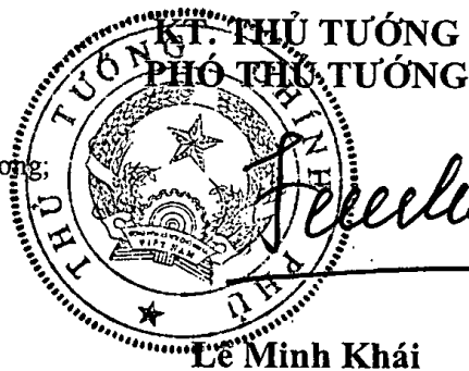
Lê Minh Khái